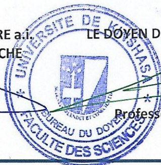
Professeur PHUKU PHUATI